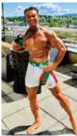
美しいシアトルの景色と共に

は、結果的に美容にも健康にもつながると感じています。 そして年齢を重ねるほど、健康を維持するための筋トレの大切さを実感しています。特に中高年女性こそ、筋肉の恩恵を最も受ける世代なのかもしれません。 美容とは、無理な若作りではなく、毎日の健康的な積み重ね。ロサンゼルスで日々クライアント様達と向き合いながら、その大切さを私自身も学ばせて頂いています。年齢を重ねることを悲観するのではなく、「今が一番元気で綺麗」と思える方が、一人でも増えて下されば嬉しく思います。