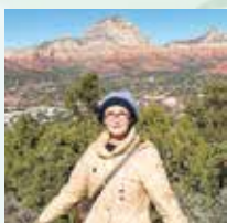
SEDONA パワースポットにて