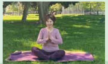
公園の木陰で心地よいヨガクラス

ご自宅 (WLA) ではヒーリングを無料で提供しています。また、「アクティベーター」としてタマラヒーラーになるためのセッションも受け付けています。(通常 $300 → ラベスト読者 $150)