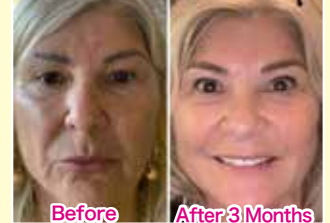
Before After 3Months