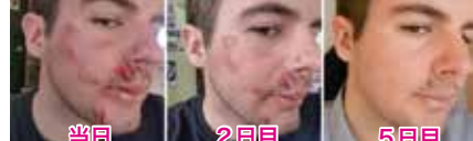
当日 2日目 5日目

※この商品は医療的な治療を目的としたものではありません。また、結果には個人差があります。